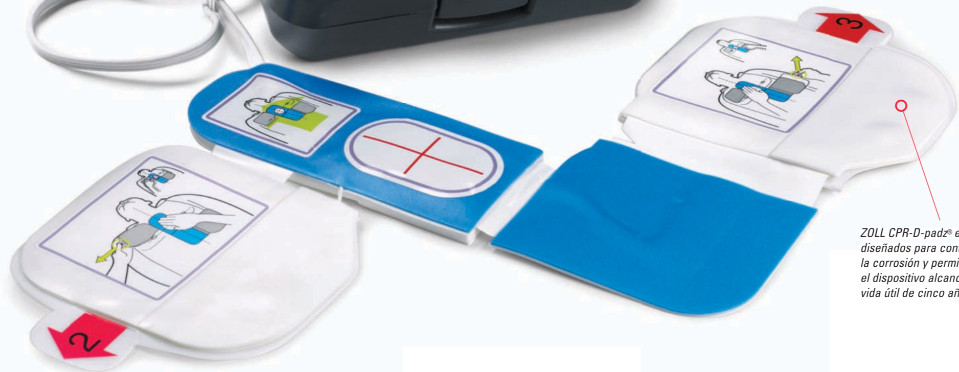
ZOLL CPR-D-padz® están diseñados para controlar la corrosión y permitir que el dispositivo alcance una vida útil de cinco años.

"Sigue siendo esencial hacer especial hincapié en realizar compresiones torácicas de alta calidad: los reanimadores deben presionar con firmeza hasta una profundidad de al menos 5 cms a un ritmo no inferior a 100 compresiones por minuto, permitir el retroceso total del tórax y minimizar las interrupciones en las compresiones torácicas." 3