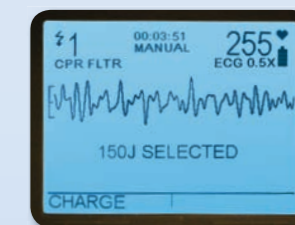
See-Thru CPR filtra el artefacto de la compresión. Lo que reduce el tiempo sin compresiones a la vez que comprueba que se haya desarrollado un ritmo organizado que permita la descarga.

See-Thru CPR® filtra el artefacto de compresión ("ruido") para que pueda ver el ritmo cardiaco subyacente del paciente (ECG) mientras realiza la RCP. Las pausas son inevitables, pero la reducción del tiempo sin compresiones da lugar a una mayor fracción de compresión torácica (CCF), la proporción de tiempo empleado en hacer compresiones durante la RCP. Una mayor CCF predice posibilidades superiores de supervivencia en pacientes con parada cardiaca fuera del entorno hospitalario. 4