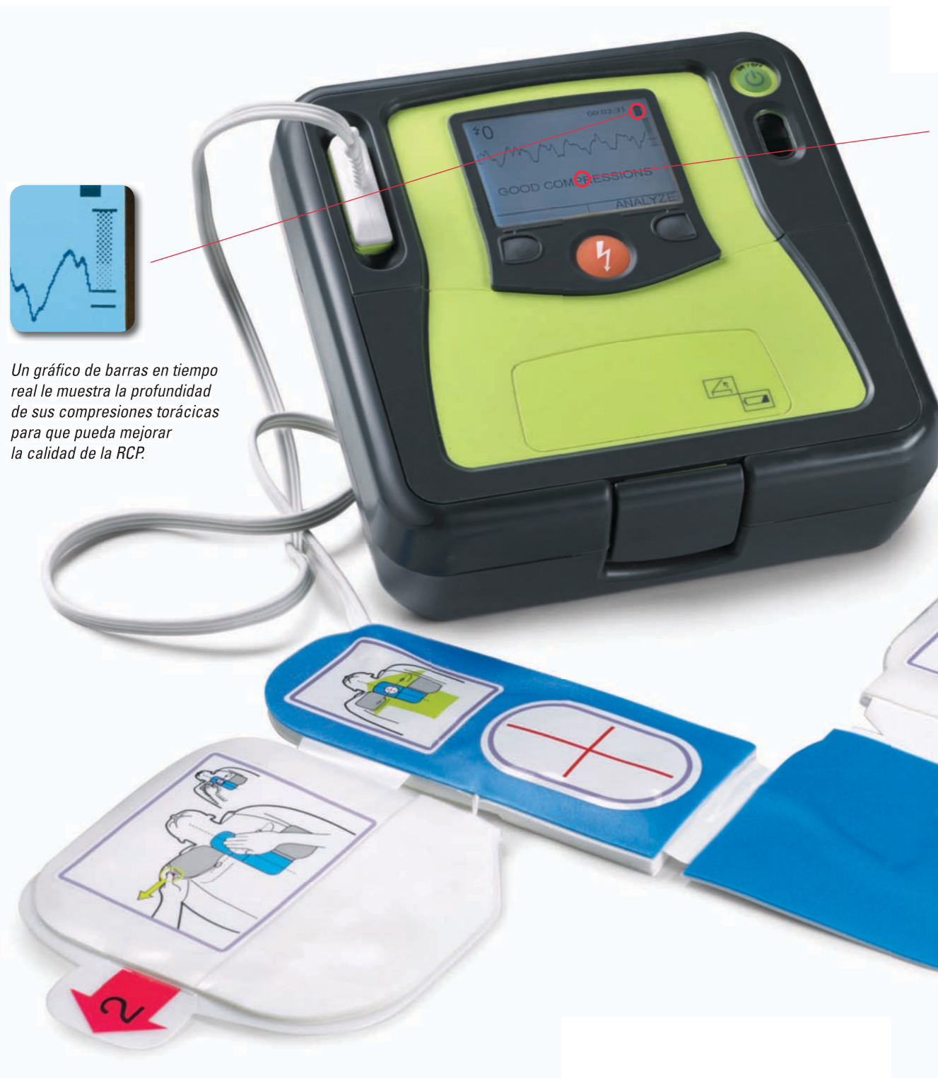
Un gráfico de barras en tiempo real le muestra la profundidad de sus compresiones torácicas para que pueda mejorar la calidad de la RCP.

De acuerdo con las normas 2010 de la American Heart Association, "la tecnología de indicaciones sobre la RCP e información en tiempo real como los dispositivos de aviso visual y sonoro pueden mejorar la calidad de la RCP". 1 El AED Pro® de ZOLL® AED Pro® ofrece la información que necesitan tanto los reanimadores profesionales como legos para realizar una RCP óptima.